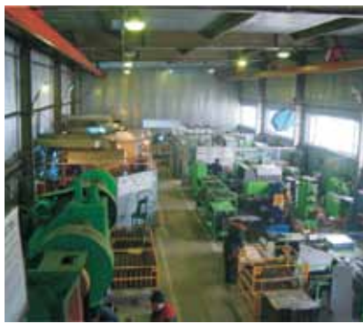
• Производственный цех АО «Келет»

Основные направления его работы: поставка оборудования для водоснабжения, вентиляции и отопления - это те три кита, на которых предприятие крепко и уверенно стоит без малого 20 лет.