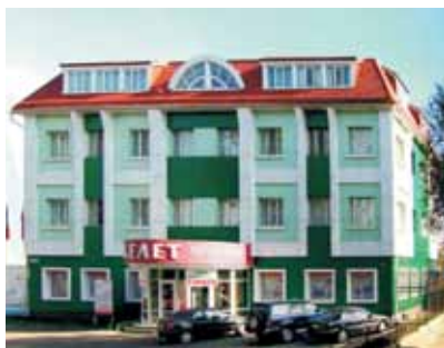
• Торговый дом АО «Келет»

АО «Келет» отметит свой 20-летний юбилей.